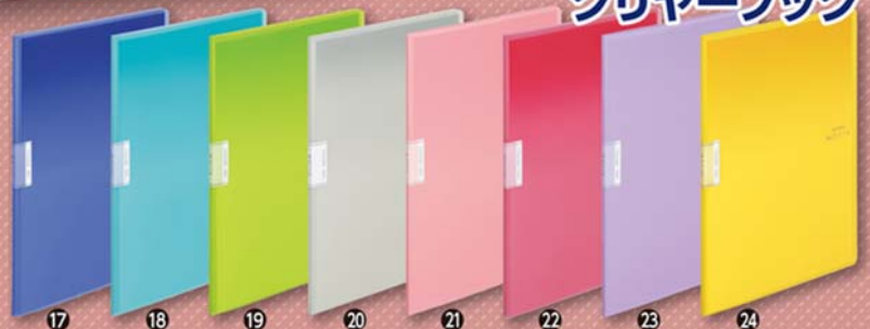
ココロ クリアブック(モット)(固定式)